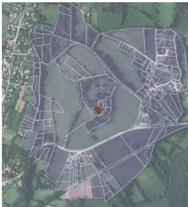
Délimitation proposée du PDA (extrait PDA)

L'évolution du périmètre proposée par la commune laisse apparaître une réduction de son enveloppe sur sa partie nord ainsi que sur sa partie ouest, au niveau de la zone pavillonnaire.